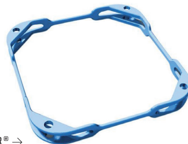
L'IRIS EXPANDER® →