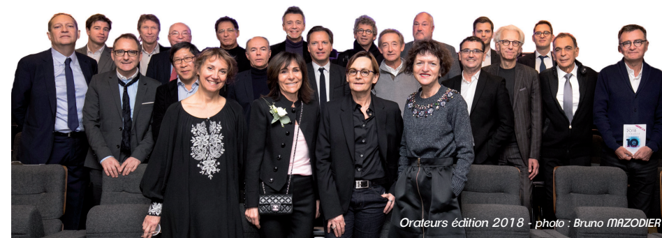
Orateurs édition 2018